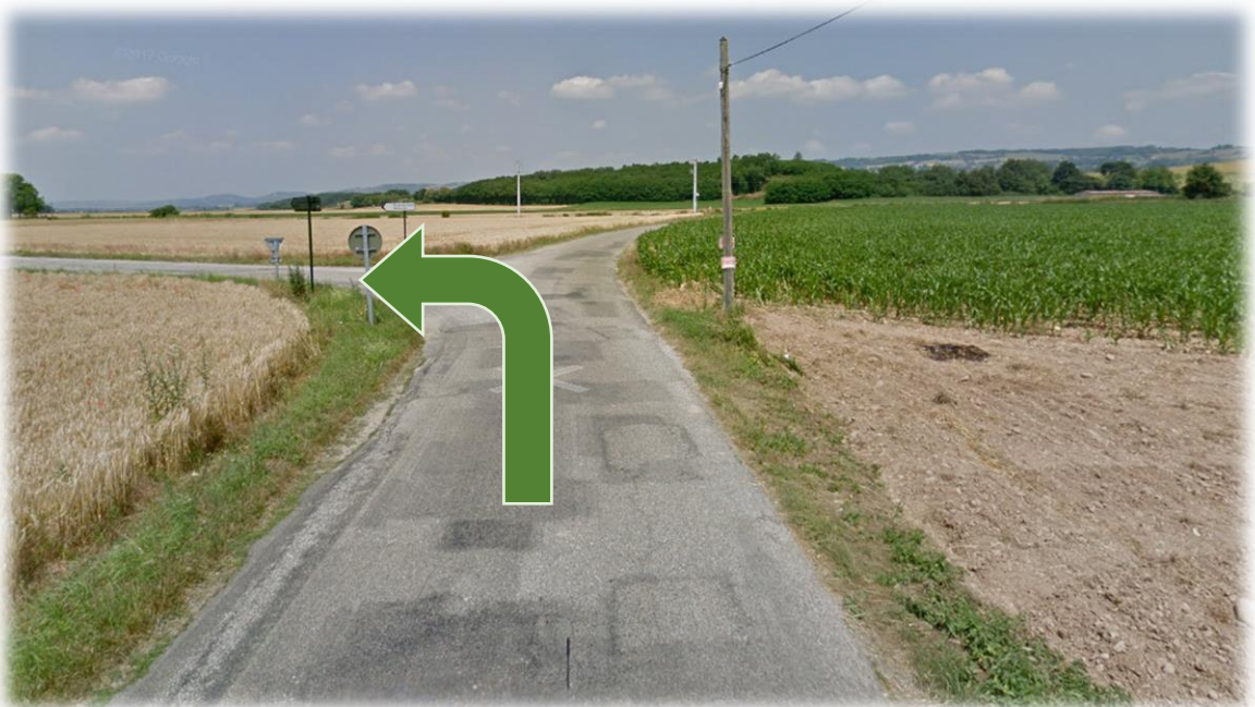
Figure 4: Intersection

Volitude - Aéroport Grenoble Isère, Zone Nord, 38590 Saint-Étienne-de-Saint-Geoirs