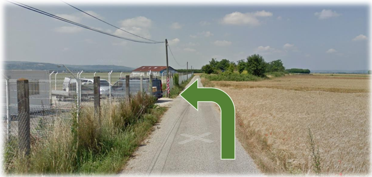
Figure 5: Parking Volitude

Volitude - Aéroport Grenoble Isère, Zone Nord, 38590 Saint-Étienne-de-Saint-Geoirs