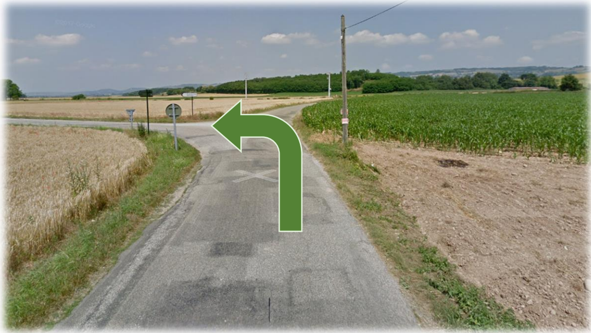
Figure 8: Intersection