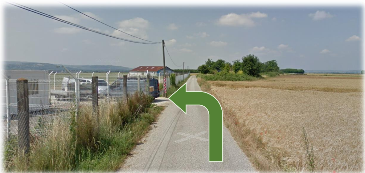
Figure 9: Parking Volitude

Volitude - Aéroport Grenoble Isère, Zone Nord, 38590 Saint-Étienne-de-Saint-Geoirs