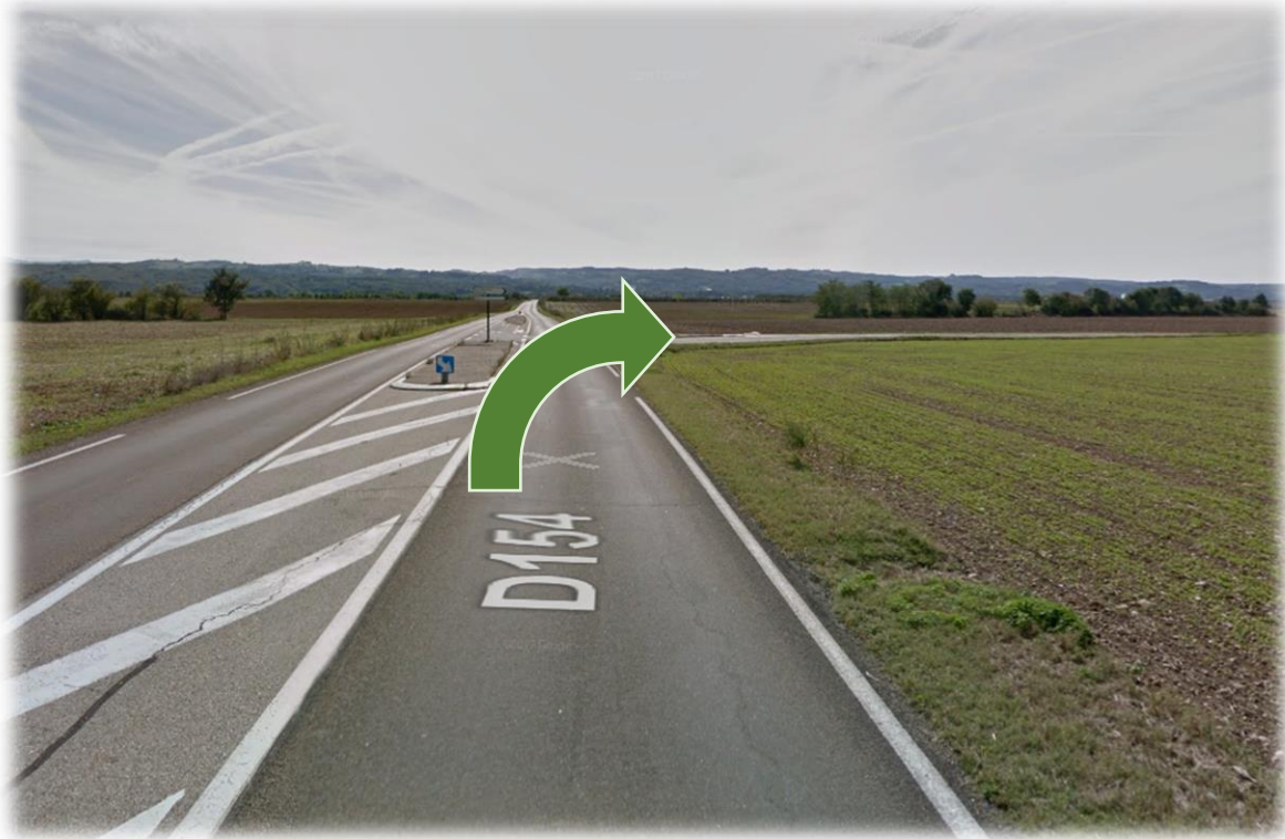
Figure 7: Intersection direction Aéroclub Parachutisme