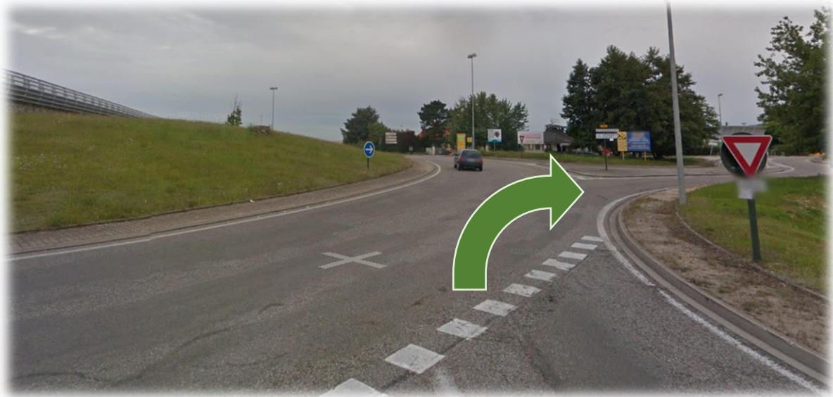
Figure 1: Rond-point de l'Aéroport