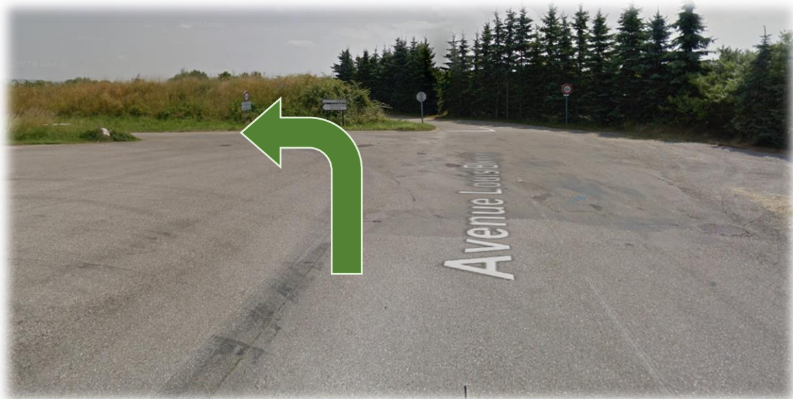
Figure 3: Virage gauche direction Aéroclub Parachutisme