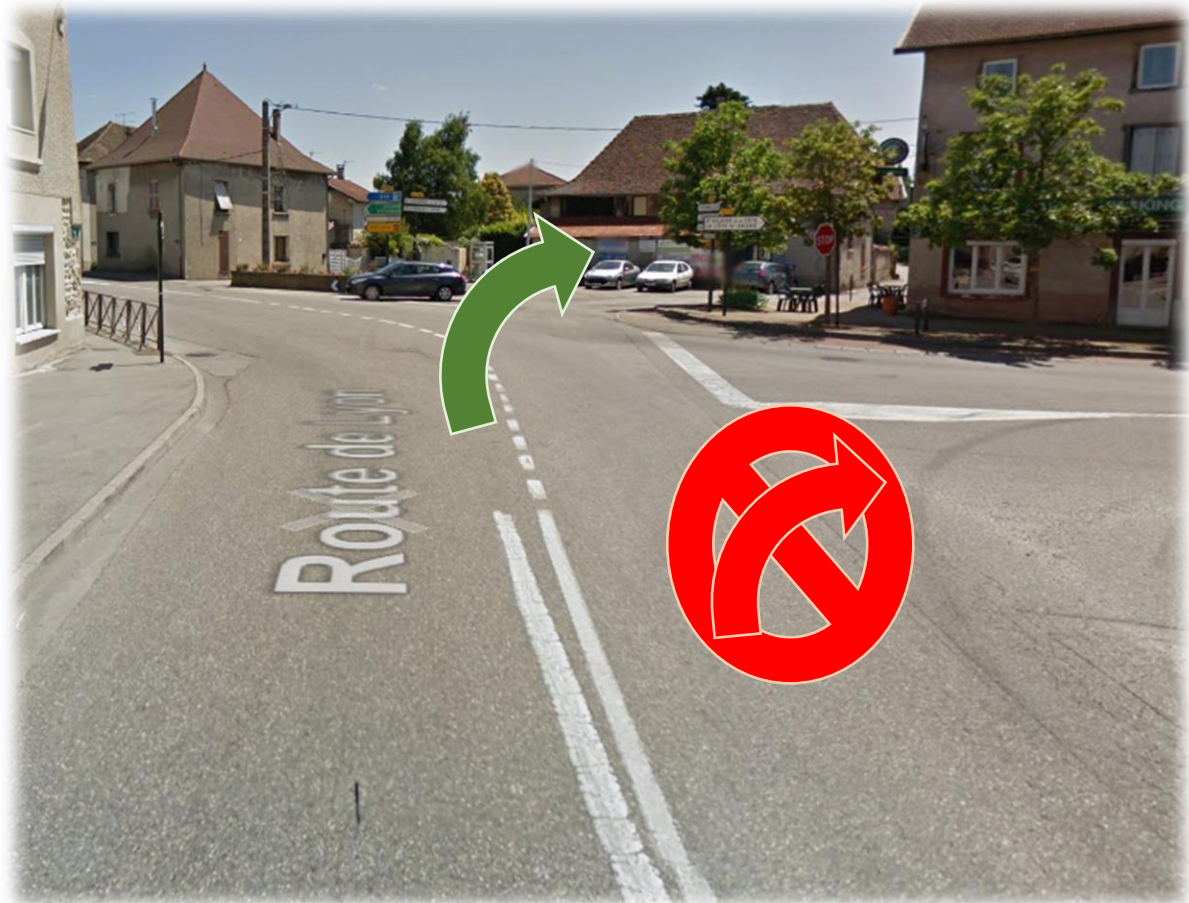
Figure 6: Intersection de la Frette