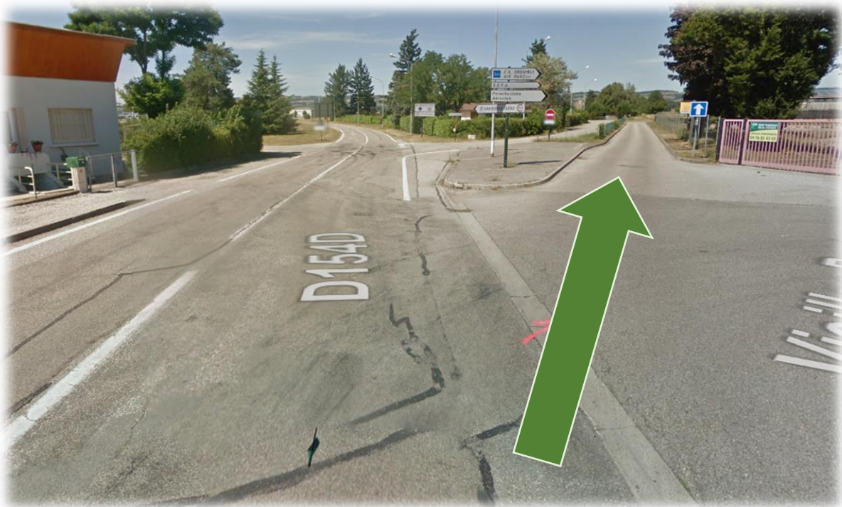
Figure 2: Direction Parachutisme, Aéroclub

Volitude - Aéroport Grenoble Isère, Zone Nord, 38590 Saint-Étienne-de-Saint-Geoirs